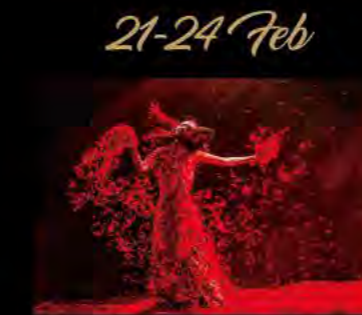
ヤン・リーピンの霸王別姫 〜十面埋伏〜 Yang Liping Under Siege-Farewell My Concubine

2019.2.10(日) 15:00開演 指揮:テオドール・クルレンツィス 管弦楽:ムジカエテルナ ヴァイオリン:パトリツィア・コパチンスカヤ <曲目・演目> チャイコフスキー:「ヴァイオリン協奏曲」 チャイコフスキー:「交響曲 第6番「悲愴」」 全席指定(税込) SOLD OUT S¥20,000 A¥16,000 B¥13,000 C¥10,000 D¥7,000 *未就学児童入場不可。 主催:Bunkamura