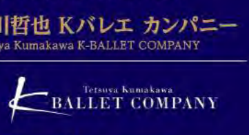
熊川哲也 Kバレエ カンパニー Tetsuya Kumakawa K-BALLET COMPANY

2018.12.24(日) 15:00開演 指揮:クリスティアン・バスケ ソリスト:吉田珠代(ソプラノ)、中島都子(アルト)、清水徹太郎(テノール)、上江幸人(バリトン) 合唱:東京フィル特別合唱団 児童合唱:杉並児童合唱団 全席指定(税込) チケット発売中 S¥12,800 A¥10,000 B¥8,000 C¥6,000 *4歳以下入場不可、5歳以上チケット必要。 *12月16日:30公演のみS子ども席あり、チケットスペースのみ取扱い。 3歳以下入場不可、4歳以上チケット必要。 2019年 3月「カルメン」 6月「シンデレラ」 9月「マダム・バタフライ」 11月「くるみ割り人形」