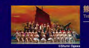
Daiwa House presents 「くるみ割り人形」

オーチャード定期演奏会 第915回:2019.1.27(日) 15:00開演 指揮:アンドレア・バッティストーニ リムスキー=コルサコフ:交響組曲「シェエラザード」 ほか 第917回:2019.2.17(日) 15:00開演 指揮:ジョン・ミンソフ マーラー:交響曲 第9番 第919回:2019.3.21(水) 15:00開演 指揮:ミハイル・プレトニョフ ヴァイオリン:ユートン・ツェン チャイコフスキー:ヴァイオリン協奏曲 ほか 全席指定(税込) 1回券 チケット発売中 S¥10,000 A¥8,500 B¥7,000 *BunkamuraでのSS席(¥15,000)・C席(¥5,500)のお取扱いがございません。 管弦楽:東京フィルハーモニー交響楽団 主催:公益財団法人 東京フィルハーモニー交響楽団