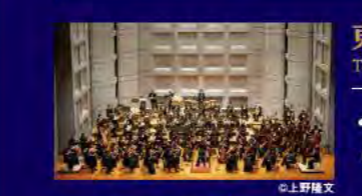
東京フィルハーモニー交響楽団 Tokyo Philharmonic Orchestra

フランチャイズ オーケストラ・バレエ団 Franchising Companies Bunkamuraオーチャードホールは、1989年に日本初のフランチャイズ制の運営形態を導入しました。恒常的に劇場を使用する団体がいることで、劇場はその特性や魅力を最大限に発揮でき、芸術家にとっても本拠地があることで、実力を磨き更に成長できるなど多くのメリットがあります。このシステムが劇場の個性を創り、日本の文化・芸術を高めると考え、1989年に東京フィルハーモニー交響楽団と、2018年には新たにKバレエ カンパニーとフランチャイズ契約を締結しました。劇場と強固な繋がりを築く2団体との連携で、皆様に一層豊かな芸術をお届けしてまいります。