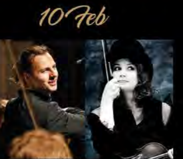
テオドール・クルレンツィス & ムジカエテルナ 初来日公演 Teodor Currentzis & MusicaAeterna

2019.1.2(水)-3(木) 15:00開演 指揮:大友直人 管弦楽:東京フィルハーモニー交響楽団 ギター:村治佳織 可会:明岡 聡 <曲目・演目> J.シュトラウスⅡ:ワルツ「春の声」 ロドリゴ:アランフェス協奏曲 ラヴェル:ボレロ ほか 全席指定(税込) チケット発売中 S¥6,500 A¥5,000 B¥3,500 *未就学児童入場不可。 主催:Bunkamura/公益財団法人 東京フィルハーモニー交響楽団 協賛:株式会社三陽商会