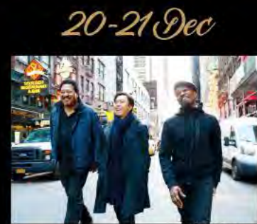
小曽根真 クリスマス・ジャズナイト2018 Makoto Ozone Christmas Jazz Night 2018

多彩な才能でジャンルを超えた活躍を続けるジャズ・ピアニスト、小曽根真が贈る音楽のクリスマス・プレゼント。今回は昨年待望の再始動を果たした最強のトリオ、「小曽根真 THE TRIO」がオーチャード初登場。また、数々の大物ミュージシャンとの共演で注目の新鋭ヴォーカル、クリスティ・ダシールをゲストに迎える。今年も熱いサウンドとともにクリスマスを！