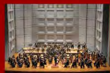
N響オーチャード定期 2018-2019シリーズ NHK Symphony Orchestra, Tokyo Orchard Hall Series 2018-2019

2019.8.3(土)-4(日) 開演時期未定 総合演出・振付・総監督:熊川哲也 芸術監督:浅川紫織 音楽:チャイコフスキー 指揮:井田勝大 管弦楽:シアター オーケストラ トーキョー 出演:Kバレエ ユース、Kバレエ カンパニー 料金未定 主催:K-BALLET/Bunkamura 特別協賛:花王株式会社