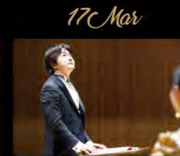
山田和樹アンセム・プロジェクト Road to 2020 Kazuki Yamada Anthem Project Road to 2020

2019.2.21(木)-2.24(日) 全5回公演 芸術監督・演出・振付:ヤン・リーピン 出演:ヤン・リーピンカンパニー 全席指定(税込) チケット発売中 S¥12,000 A¥9,800 B¥7,800 *未就学児童入場不可。 *ヤン・リーピンは出演いたしません。 主催:TBS/Bunkamura/ABax 後援:中国大使館/BS-TBS