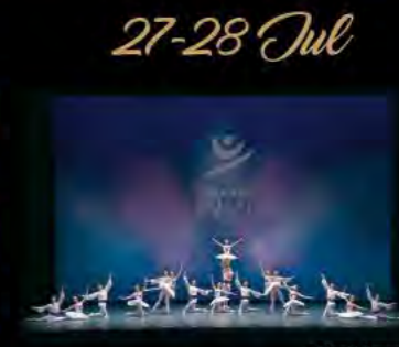
オーチャード・バレエ・ガラ 〜JAPANESE DANCERS〜 Orchard Ballet Gala -Japanese Dancers-

2019.3.17(日) 15:00開演 指揮:山田和樹 管弦楽:日本フィルハーモニー交響楽団 テノール:西村 悟 合唱:東京混声合唱団 <曲目・演目> 国歌集(君が代、J・ウィリアムズ編曲アメリカ合衆国国歌、コモロ連合国歌) ホルスト:組曲「惑星」より「木星」 ほか 全席指定(税込) チケット発売中 S¥8,000 A¥6,000 B¥4,000 *未就学児童入場不可。 主催:Bunkamura