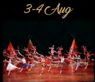
Kao presents Kバレエ ユース 第4回公演「くるみ割り人形」 K-BALLET YOUTH 4th Performance「The Nutcracker」

2019.7.27(土)-28(日) 開演時期未定 総合監修:熊川哲也 出演:海外のトップカンパニーで活躍する日本人ダンサー 全席指定(税込) 一般発売日7.17 S¥10,800 A¥8,000 B¥6,000 *4歳以下入場不可、5歳以上チケット必要。 *未就学児童入場不可。 主催:Bunkamura