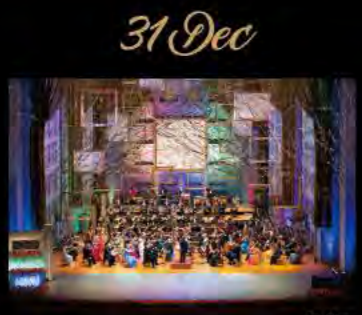
東急ジルバスターコンサート 2018-2019 Tokyu Silvester Concert 2018-2019