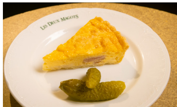
プチ・キッシュ PETIT QUICHE