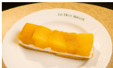
タルトタタン TARTE TATIN