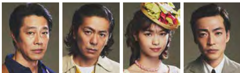
堤真一 森田剛 西野七瀬 大東駿介