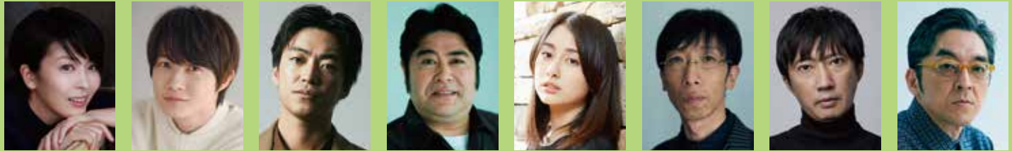
松たか子 神木隆之介 大東駿介 皆川猿時 早見あかり 小松和重 菅原永二 村杉蟬之介