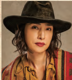
天海祐希 AMAMI YUKI