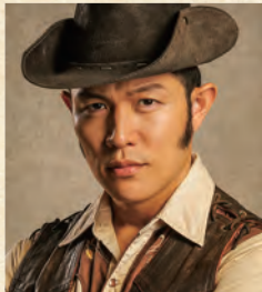
鈴木亮平 SUZUKI RYOHEI