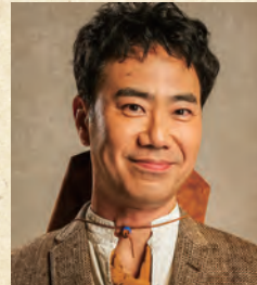
藤井隆 FUJII TAKASHI